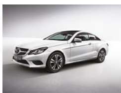
149 Blanco Polar