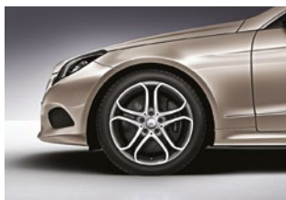
E 250 Coupé y Convertible 235-40 R 18 delante 255-35 R 18 detrás

Las llantas son un elemento técnico imprescindible en cualquier vehículo, pero tienen también su importancia a nivel emocional: pocos detalles son tan relevantes como elegir los rines perfectos para su vehículo soñado. De ahí que hayamos preparado un elenco variado y atractivo para usted.