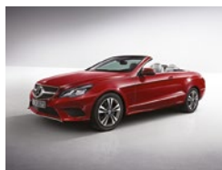
590 Rojo Ópalo