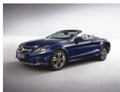
890 Azul Cavansita