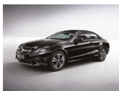
197 Negro Obsidiana