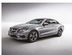
792 Plata Paladio