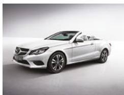
149 Blanco Polar