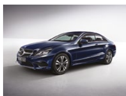
890 Azul Cavansita