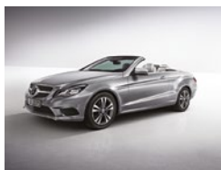
792 Plata Paladio