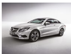
775 Plata Iridio