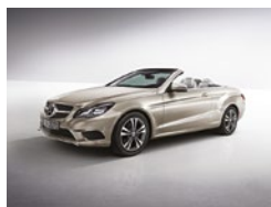
296 Plata Aragonita