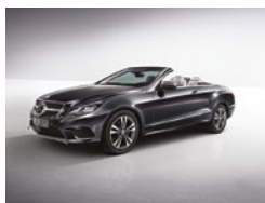
755 Gris Tenorita