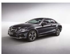
755 Gris Tenorita