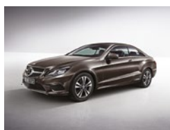
526 Marrón Dolomita