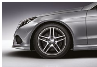
E 400 Coupé y Convertible 235-40 R 18 delante 255-35 R 18 detrás