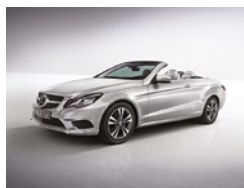
775 Plata Iridio