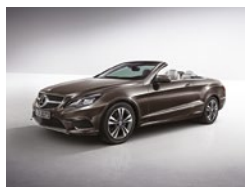
526 Marrón Dolomita