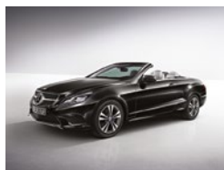
197 Negro Obsidiana