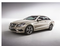
296 Plata Aragonita