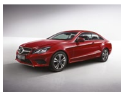
590 Rojo Ópalo